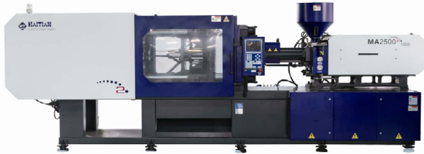
MARS II – energetski efikasne mašine

Takođe, mogao se videti i HAITIAN Mars II eco