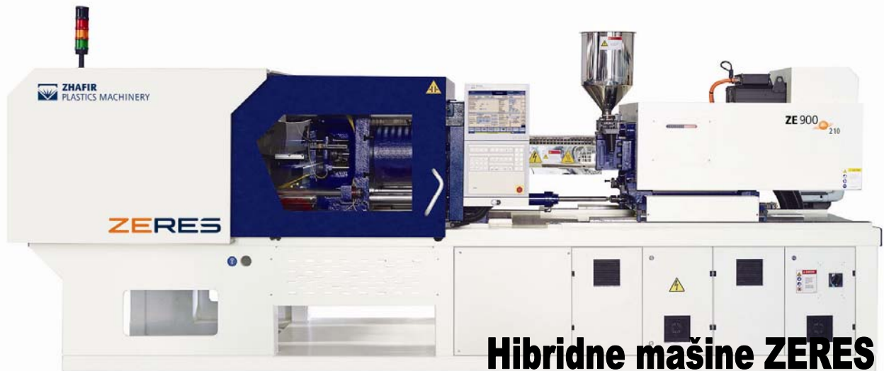
Hibridne mašine ZERES

Vodeća svetska kompanija iz oblasti proizvodnje mašina za brizganje plastike, HAITIAN International Plastics Machinery , i njihova podružnica iz Nemačke, ZHAFIR Plastics Machinery , organizovale su ovog proleća nesvakidašnju manifestaciju. U okviru evropske promocije pod nazivom “Visoka tehnologija na licu mesta” predstavljena je kompletna linija vrhunskih mašina za brizganje plastike ove kompanije. Poseban motiv bila je premijera najnovijeg modela električno-hidraulične brizgalice Zeres , koja svojim inovativnim dizajnom značajno proširuje dosadašnji opseg primena električnih brizgalica.