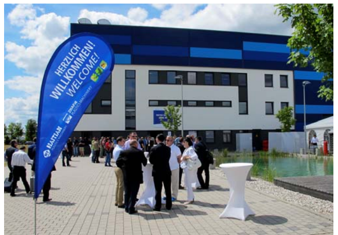
HAITIAN Open House u fabrici ZHAFIR, Nemačka

mašina u svojoj konkurenciji. Kombinujući dva sistema, servo-električni pogon i hidrauliku (hibridna mašina), Zeres elegantno premošćuje jaz između tradicionalno hidraulično orijentisanih proizvođača i najnovijih trendova u oblasti potpuno električnih brizgalica. Po svojim ključnim karakteristikama, Zeres je identičan potpuno električnoj mašini Venus II , što znači da nudi maksimalnu dinamičnost i preciznost proizvodnje, uz dvocifrenu uštedu energije i znatno nižu cenu u odnosu na potpuno električne brizgalice.